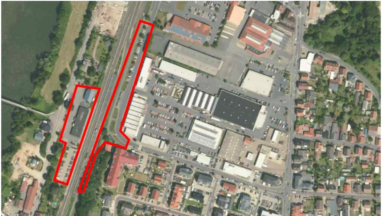
Umgriff der Westseite des Bahnhofs Obernburg/Elsenfeld