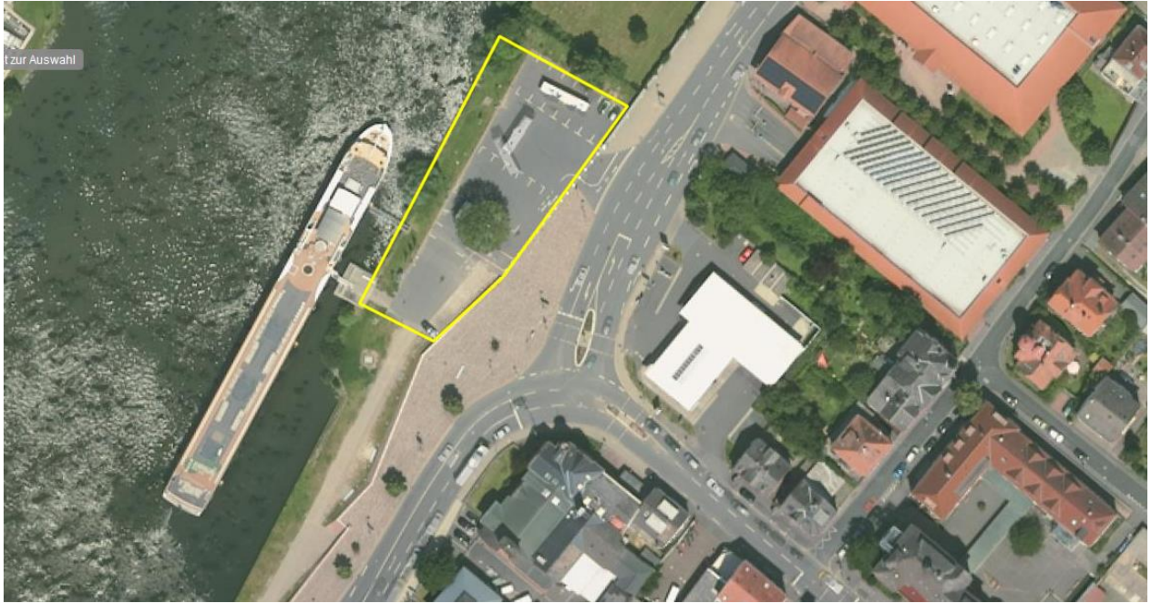
Gesamte befestigte Fläche des Parkplatzes gegenüber der Esso-Tankstelle zwischen der Jahnstraße und des Mains, einschließlich des dortigen Uferbereiches.