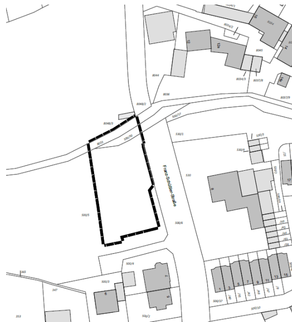
Lageplan Teilbereich Ost (unmaßstäblich)