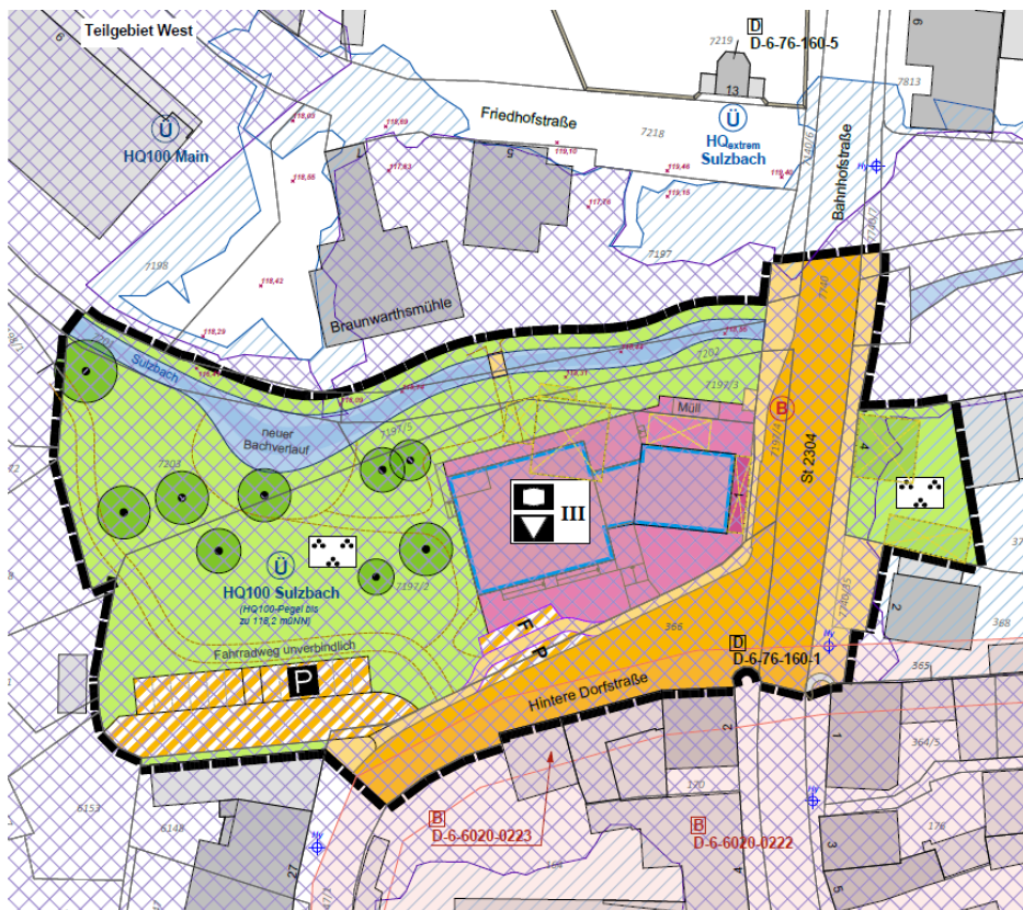
Bebauungsplanvorentwurf Teilgebiet West (unmaßstäblich)

Der westliche Teilabschnitt bildet den Schwerpunkt der geplanten Umgestaltungsmaßnahmen. Dort sollen gegenüber der Braunwarthsmühle ein Seniorentreff und eine Bücherei entstehen und die bisher gering genutzte öffentliche Grünfläche gestalterisch aufgewertet und als Spiel- und Erholungsfläche entwickelt werden. In diesem Zusammenhang ist auch die Freilegung eines Teilabschnittes des verrohrten Sulzbaches zu sehen.